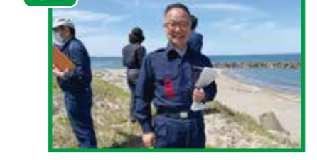
写真 5/25 西目地区及び本荘地区 県への要望箇所の視察・協議