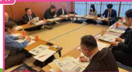
写真 3/17 GIGAスクール構想と秋田県における探究型学習の推進に関する勉強会