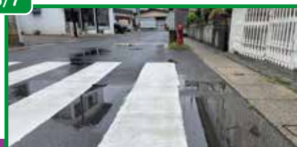
写真 5/7 キリスト教幼稚園前市道 現地確認